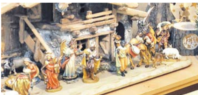
Handgeschnitzt aus den Tiroler Bergen: zauberhafte Krippen von Wandera.