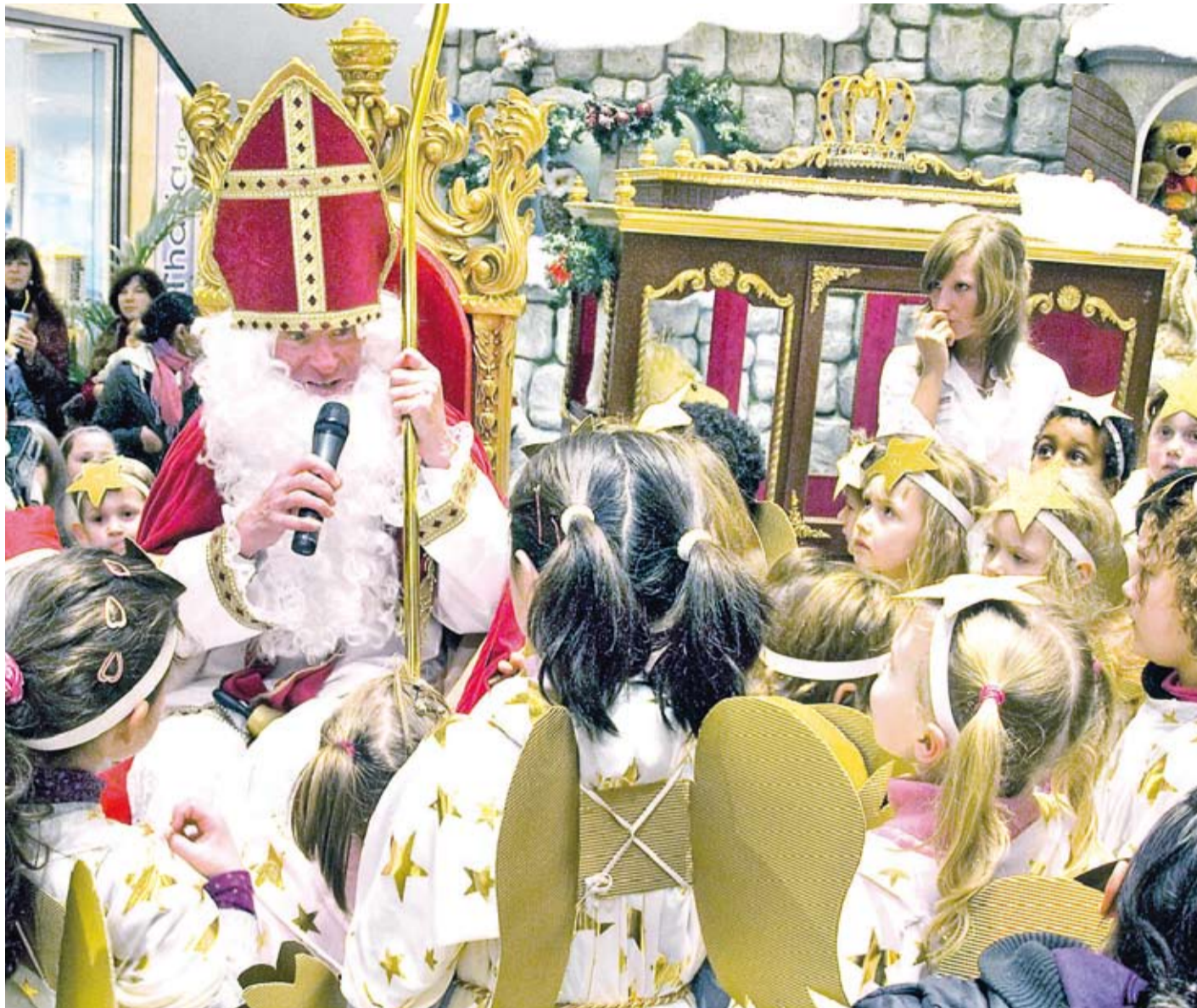
Die kleinen Besucher lauschen in süßen Engelskostümen wie gebannt dem Nikolaus, der nicht nur eine Geschichte, sondern auch Geschenke mitbringt.

AKTION Pünktlich am 6. Dezember besucht der Nikolaus die City-Arkaden und bringt Geschenke mit.