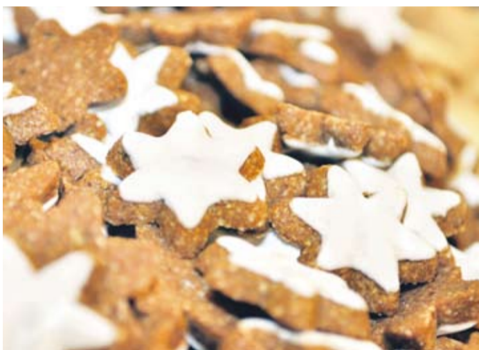
Duftende, knusprige Zimtsterne sind bei Evertzberg ein Verkaufsschlager.